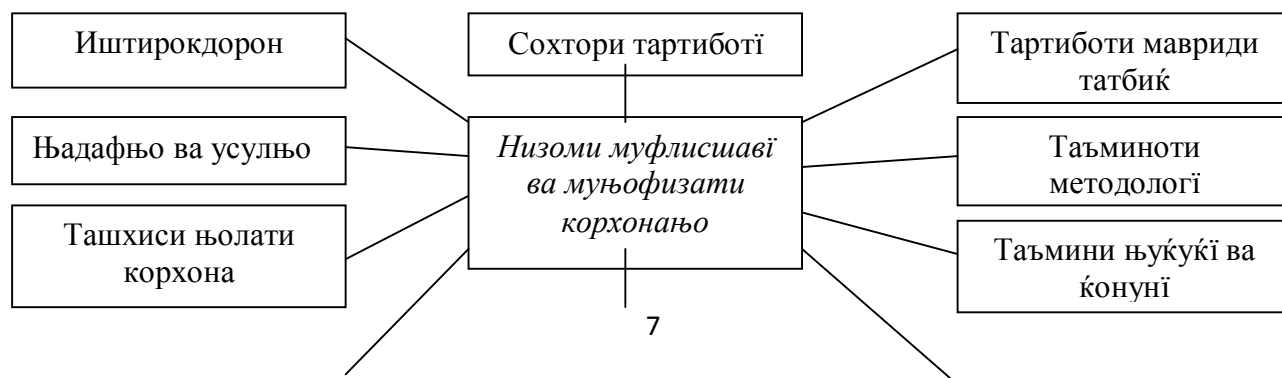
расми 1. Низоми муфлисшавии корхона

Иқтисоди бозоргонӣ, ки дар давоми даҳсолаву садсолаҳои зиёд асоси инкишофи кишварҳои ғарбӣ мебошад, низоми муайяни назорат, ташхис ва то ҳадди имкон ҳимояти корхонаҳоро аз шикасти кулӣ ё ба ибораи дигар, низоми муфлисшавӣ ва ҳифзи корхонаҳоро таҳия намуда ва ба вучуд овардааст (ниг. ба расми 1).