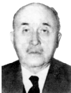
Расми 5. Жан Монне (1888-1874) иқтисодчи молшиноси Фаронса, ташаббускори ба имзо расидани қарордоди иттифоқи аврупоии

охиринаи Ҷанги дуюми ҷаҳонӣ ва баъди он ҳамкориҳои иқтисодиро вусъат доданд. Соли 1944 дар шаҳри Бретон-Вудси ИМА дар Конфронси Милали Муттаҳид намоёндогони 44 давлати ҷаҳон "низоми асъории Бретонвуд"-ро таъсис намуданд. Муассисони ин низом дар бораи муайян намудани қурби тиллоии доллари амриқоӣ аҳду паймон қарда, ҳуҷҷати дахлдор ба имзо расониданд. Ин созмон соли 1995 ба Созмони Умумиҷаҳонии Тиҷорат мубаддал гардида, имконият дод, ки давлатҳои аъзо боҷи кам пардозанд ва савдои озодро васеъ кунанд.