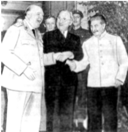
Расми 2. У Черчилл, Г. Трумэн ва И. Сталин, ки баъди конфронси байналҳалқии Потсдам дар ду тарафи сангари бо ҳам душман қарор гирифтанд.

Замина барои ба вучуд омадани низоми нав дар муносибатҳои байналҳалқӣ ҳанӯз дар рафти Ҷанги дуҷоми ҷаҳонӢ гузошта шуд. Солҳои 1941-1942 намояндагони Иттиҳоди давлатҳои зиддифашистӣ борҳо ҷамъ омада, роҳҳои ҳалли масъалаҳои гуногуни дохили