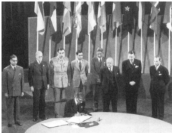
Расми 4. Маросими ба имзо расидани Оинномаи СММ дар Конференсияи Сан-Франсиско 26.06.1945.

муносибатҳои байналхалқии баъдичангӣ тавлиди Созмони Милали Муттаҳид буд. Он дар Конфронси байналхалқии дар шаҳри Сан-Франсискои ИМА, ки аз 25 апрел то 26 июни соли 1945 баргузор гардида буд, тавлид ёфтааст. Муассисони СММ ҳамаи 51 давлати аъзои Иттиҳоди зидди фашизм буданд. Дар рӯзи охири конфронс - 26 июн Оинномаи СММ қабул карда шуд, ки он 24 октябри соли 1945 ба эътибор даромад. Ҳа-мин рӯз ҳамчун Рӯзи ташкили Созмони