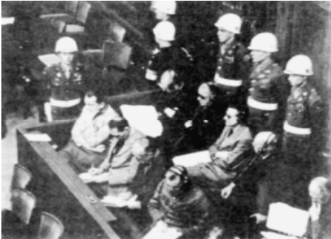
Расми 1. Муруфиаи суди Нюрнберг.

ДАР МУНОСИБАТҶОИ БАЙНАЛҲАЛҚӢ. Ҷанги дуҷоми ҷаҳонӢ ба аҳли башар