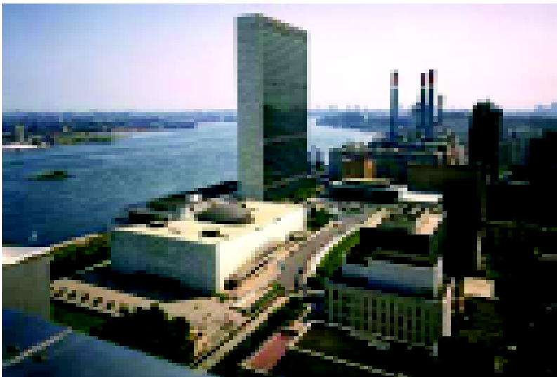
Расми 3. Қароргоҳи Созмони Милали Муттаҳид дар шаҳри Нью Ёрки ИМА.